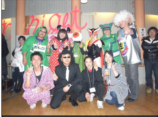
コスプレ参加者の写真(一部)

ピュアモルトクラブブログ更新中 http://www.puremalt.blog75.fc2.com/