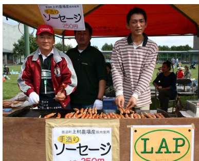
ソーセージを販売するLAP