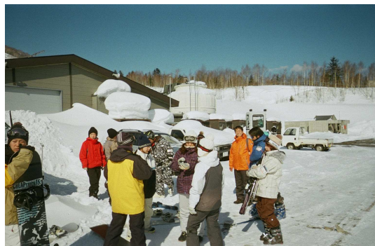
滑る準備をする参加者一同