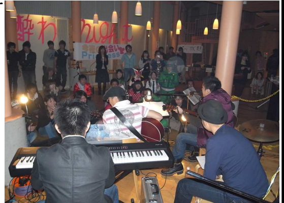
My'sの演奏を聴く参加者

第2部では夏祭りで終わったはずの「ピュアレンジャー」が復活し、スクリーンにて「レンジャー THE MOVIE」と題され、第2話が公開されました。笑いあり、感動ありの大作でした。その後鹿追の事について知ってもらおうとO×クイズを行い、なんと最後まで残った優勝者には、またまたWiiをプレゼント。その後現金争奪ジャンケン大会やお絵かき大会等を行い、それぞれの優勝者にも豪華な賞品がプレゼントされました。今回の酔わNightは賞品を豪華にして皆様に喜んでもらえるイベントとして企画しました。そして、きっとまた来年も豪華な賞品が用意されるはずですよ! 今後も多くの皆様が参加できる、そして楽しめるイベント作りをしていきます。次回の参加もお待ちしております!